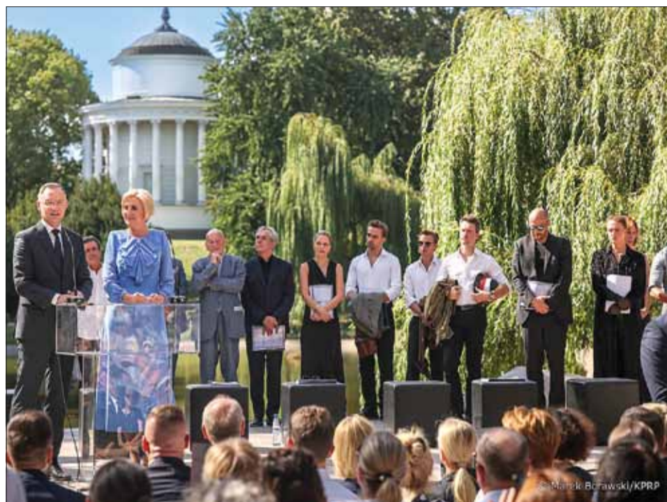
W warszawskim Ogródzie Saskim odbyła się 13. edycja akcji Narodowe Czytanie z udziałem Andrzeja Dudy i Agaty Kornhauser-Dudy. Para Prezydencka zainaugurowała wspólną lekturę „Kordiana” Juliusza Słowackiego.

Na przestrzeni lat dramat KORDIAN doczekał się wielu wydań i był chętnie wystawiany w teatrach. Do dziś pozostaje jednym z najczęściej interpretowanych i dyskutowanych utworów, zajmując poczesne miejsce w kanonie polskiej literatury.