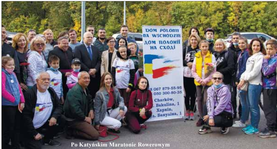
Po Katyńskim Maratonie Rowerowym