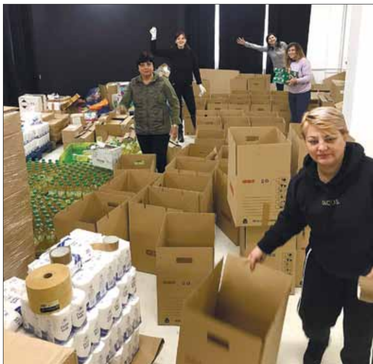
Formujemy paczki humanitarne dla kolejnego konwoju