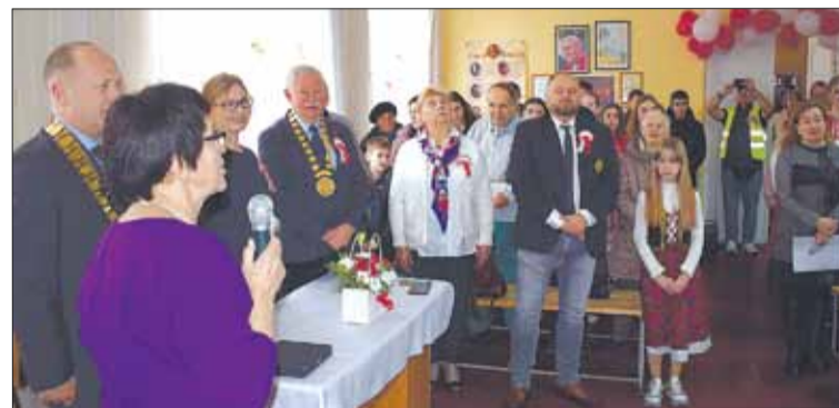
Uroczysta akademii w szkole

Od 1997 roku dobrą tradycją w Kołomyi na Przykarpaciu w Towarzystwie Kultury Polskiej „Pokucie” i Polskiej Sobotniej Szkole im. St. Wincentza stało się upamiętnianie każdej rocznicy Niepodległości Polski.