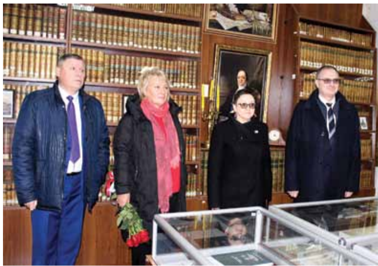
W Muzeum Starodruków Biblioteki Państwowego Uniwersytetu w Nieżynie im. M. Gogola, gdzie można zobaczyć unikatowe rarytasy drukarstwa polskiego z początku XVI wieku