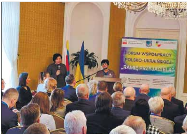
Na Forum „Ramię przyjaciela” w Pułtusku

Przeprowadziliśmy ponad 100 rozmaitych imprez tematycznych i tradycyjnych, np.: wspólne Wigilie i spotkania opłatkowe w katedrze Narodzenia dla dzieci (w EWC „Harmonia” i przedszkolu „Bdżiłka”), uczestniczyliśmy we wspólnej modlitwie i uroczystości Wielkanocnej. Zorganizowaliśmy imprezy „Z Polską w sercu”, wzięliśmy udział w otwarciu XXV Międzynarodowego Muzycznego Festiwalu w Charkowie, we wspólnym świętowaniu