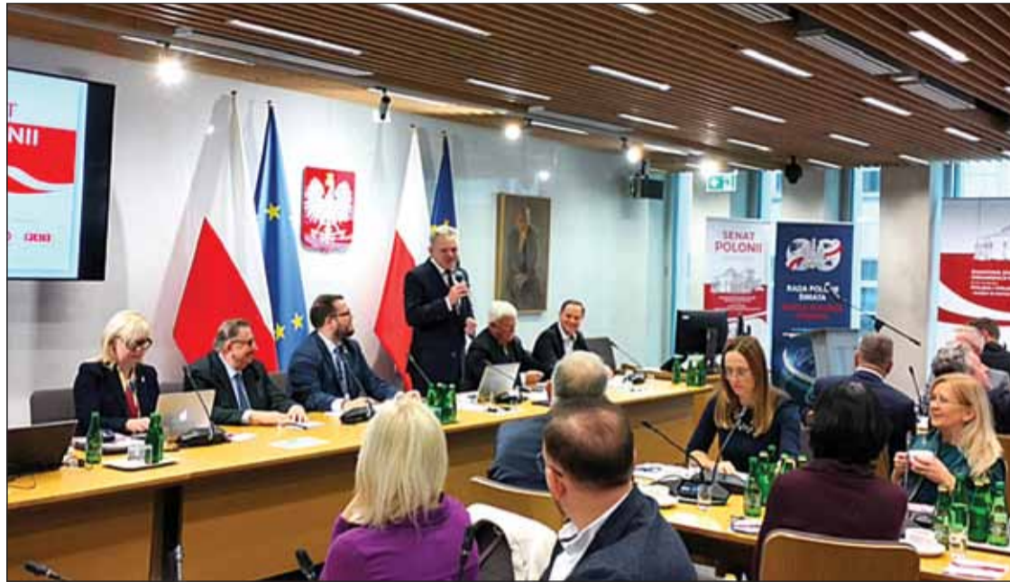
Podczas sesji inauguracyjnej obrady się odbywały w gmachu Sejmu RP

międzypokoleniowy”. Po zakończeniu obrad poprosiliśmy o opinię delegatów z Polonii ukraińskiej.