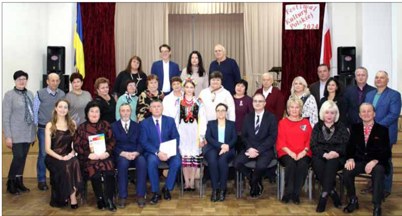
Polskie Kulturalno-Oświatowe Stowarzyszenie „Aster” w tym roku obchodzi swój piękny Jubileusz – 25-lecie działalności

Podczas spotkania w Centrum Kultury Polskiej prezes