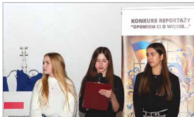
REPORTAŻ WIDEO: Grupa dziewcząt z Ukraino-Polskiego Sojuszu im. Tomasza Padury

Konkurs „Opowiem Ci o wojnie...” to wyjątkowy projekt, który ukazał siłę młodych ludzi oraz ich gotowość do dzielenia się swoimi doświadczeniami. Z nadzieją na kolejną edycję laureaci i uczestnicy powrócili do swoich domów, zabierając ze sobą nie tylko nagrody, ale także