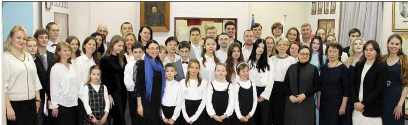
Uczniowie Polskiej Szkoły Sobotniej działającej przy Domu Polskim w Kijowie z okazji obchodów 106. rocznicy odzyskania przez Polskę Niepodległości przygotowali uroczysty koncert w postaci słowno-muzycznej kompozycji