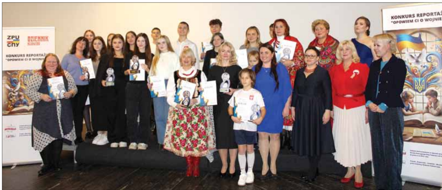
Uczestnicy, organizatorzy, członkowie jury Konkursu „Opowiem Ci o wojnie...”