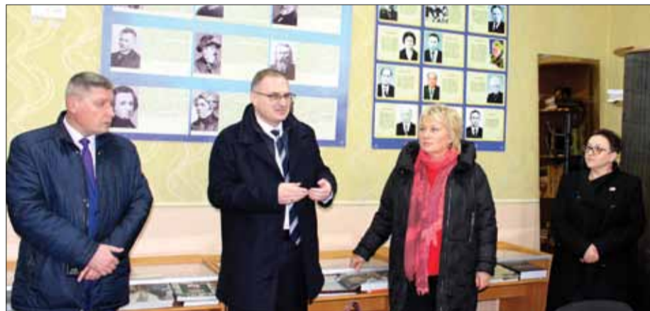
Delegacja z Kijowa odwiedzająca Centrum Kultury Polskiej w Nieżynie