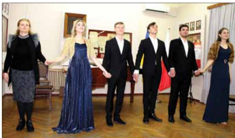
Występ studentów wokalistów z Kijowskiej Miejskiej Akademii Muzycznej im. R.M. Gliera