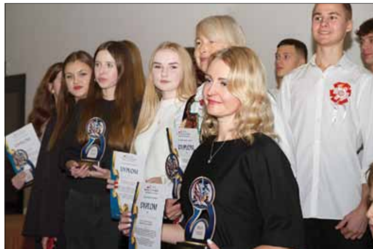
Na zakończenie wydarzenia zwycięzcy otrzymali upominki i nagrody