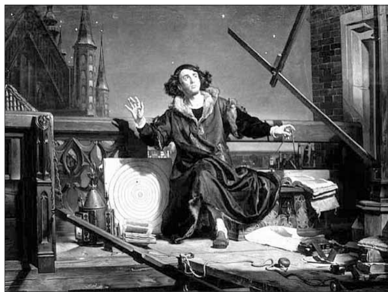
„Astronom Kopernik czyli rozmowa z Bogiem”, Jan Matejko, 1873 r.

Dzieło życia astronoma „O obrotach sfer niebieskich” wydano w 1543 r. w Norymberdze. Niestety wtedy Kopernik był już na łożu śmierci. Publikacja burzyła istniejący stan wiedzy o świecie, a Kościół umieścił ją na indeksie ksiąg zakazanych w 1616 r. i trwało to przez ponad dwieście lat.