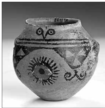
Kultura łużycka. Malowane naczynie ceramiczne z miejscowości Górka, VII w. p.n.e.

(Rzymianie nie znali tych obszarów zbyt dobrze i na ogół zdani byli na relacje swych przeważnie germańskich informatorów), albo na błędnej interpretacji naukowej, wreszcie – relacje ich mogły też być w zasadzie trafne, niemniej pobyt ludów czy raczej drobniejszych grup ludności germańskiej na ziemiach obecnie polskich miał charakter nieistotny, epizodyczny, a w okresie rzymskim jedynym liczącym się elementem etnicznym nad Odrą i Wisłą był i pozostał element słowiański.