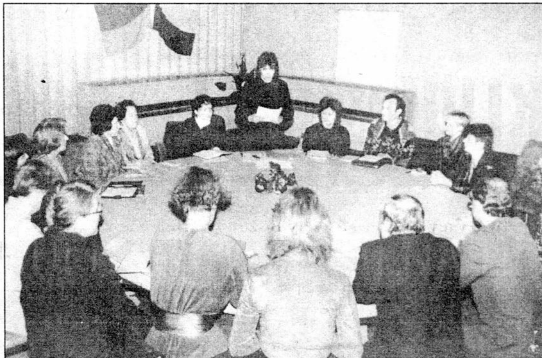
Obrady Konferencji przebiegały przy okrągłym stole