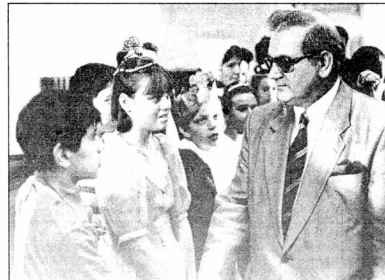
Senator Tadeusz Samborski w szkole nr 10 po spektaklu "Trzcwiczki Szczęścia"

Związek Polaków na Ukrainie wyrażają wszystkim serdeczne —