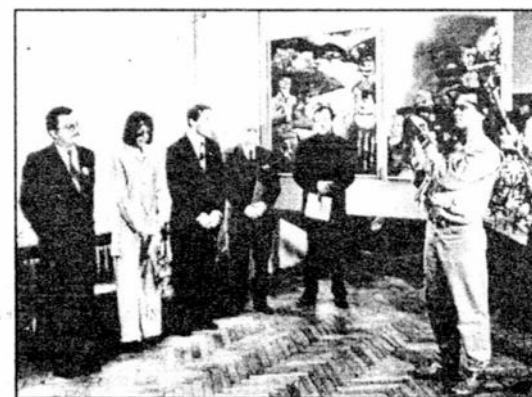
Na otwarciu wernisazu wystaw

cych obecnie na Ukrainie. Jak różnorodny i bogaty jest ten dorobek przekonał nas już na