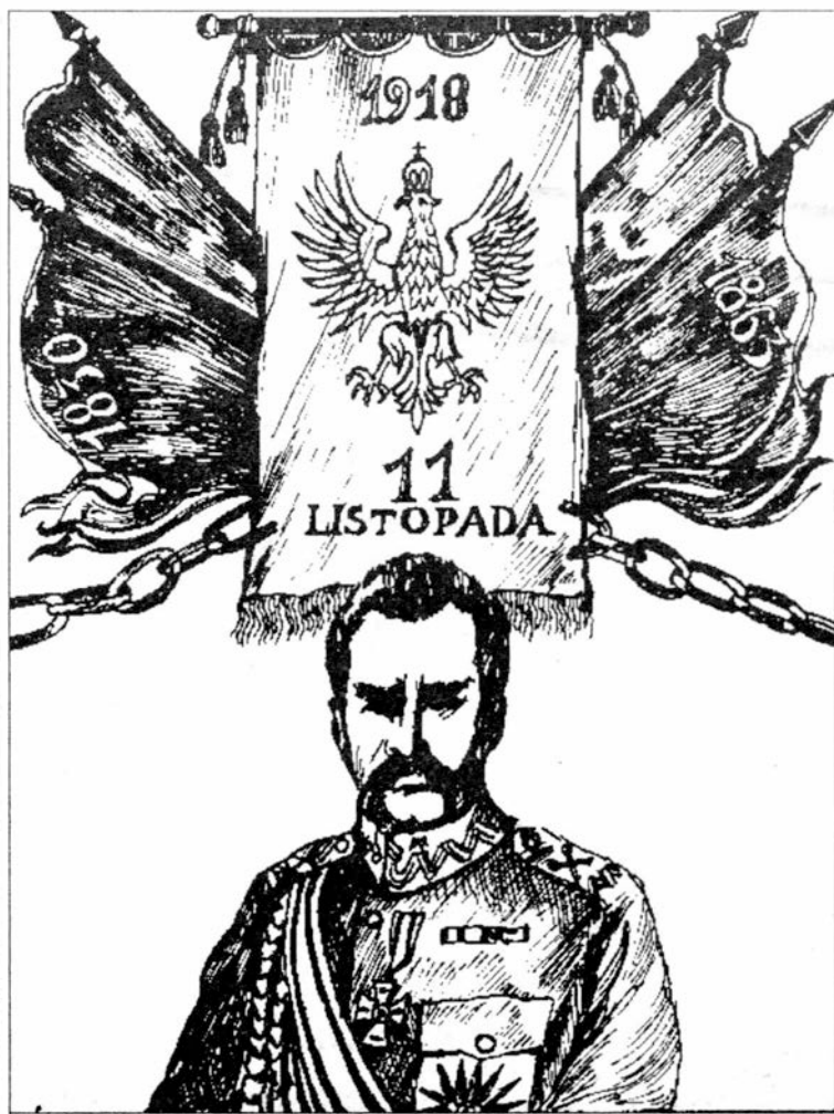
W tym dniu 78 lat temu Polska odzyskała niepodległość