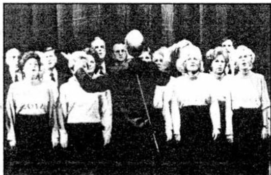
Śpiewa chór "Echo" ze Lwowa

W ramach imprezy odbyły się wspaniałe koncerty muzyki poważnej. W Katedrze Metropolitalnej z "Polskim Requiem" wystąpił jeden z najwybitniejszych współczesnych kompozytorów polskich Krzysztof Penderecki z orkiestrą Filharmonii Krakowskiej. W dawnym pałacu Sapiehów mieliśmy okazję posłuchać koncertu chóru Parafii św. Maksymiliana z Torunia. Tam też nastąpiło wręczenie nagród zwycięzcom IV Konkursu Literackiego dla Polaków z Ukrainy i prezentacja twórczości polskich poetów z Ukrainy. W dni Festiwalu dokonano we Lwowie odsłonięcia tablicy na pomniku Bartosza Głowackiego.