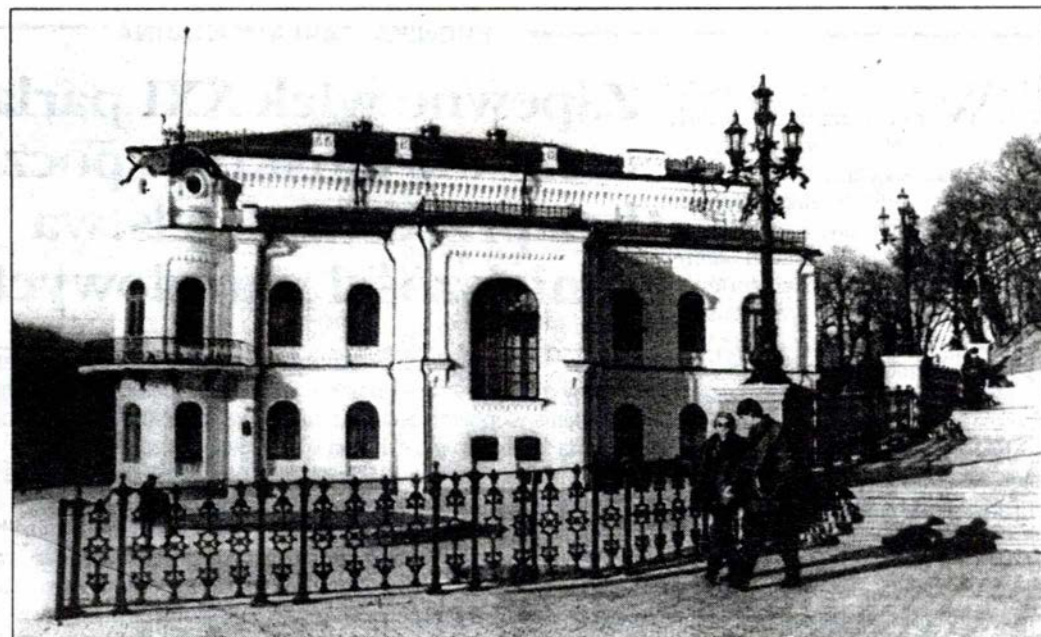
Gmach filharmonii kijowskiej, byłego zebrania kupieckiego