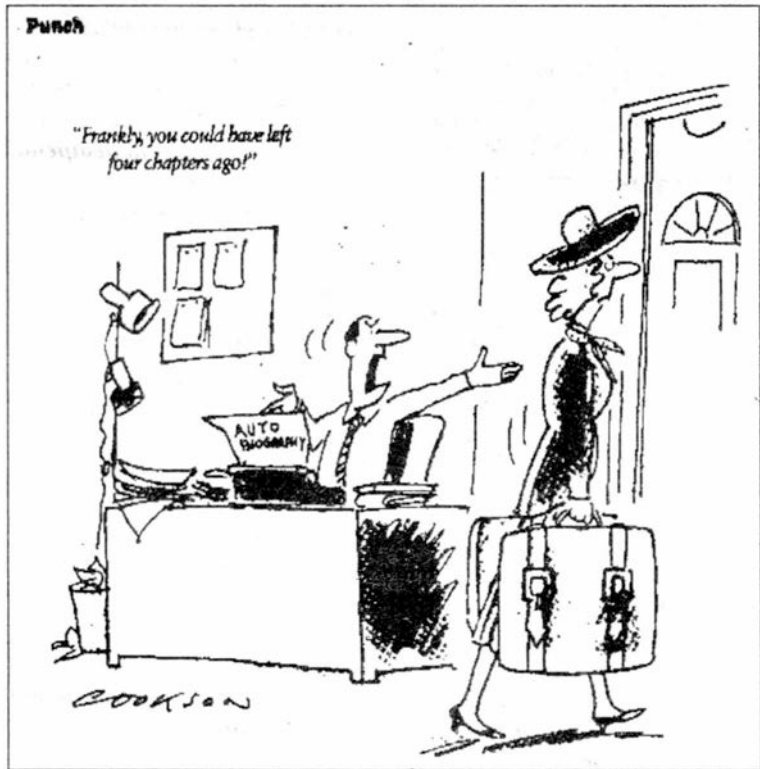
- Szczerze mówiąc, mogłaś już sobie iść cztery rozdziały temu!