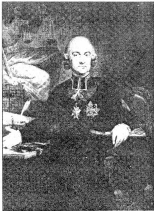
Ks. Hugo Kołłątaj

28 lutego 1997 roku minęło 185 lat od dnia śmierci słynnego polskiego działacza społecznego i filozofa epoki Oświecenia Hugo Kołłątaja (1750-1812)