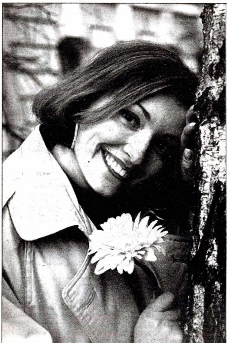
"W koniu wiosna, w pannie ślub wady odkrywa"