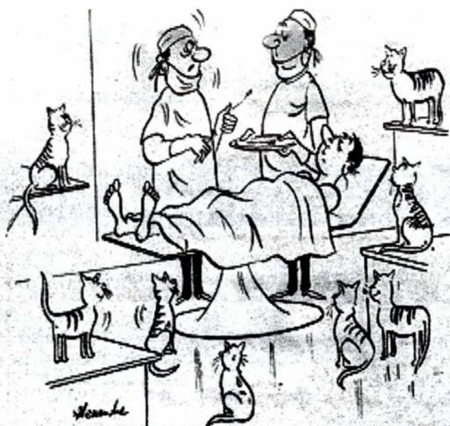
- Co za dureń znowu zapomniał zamknąć drzwi do sali operacyjnej?

Poziomo: 3) moneta polska; 6) dyktatura, prześladowanie; 7) mityczna kraina szczęścia; 8) kapłan, kleryk; 9) instalowana wewnątrz opony; 11) pod kranem na kuchni; 13) odmiana grusz; 14) zbieranie zbóż; 16) stoi na czele uczelni wyższej; 17) film, taśma; 18) wystawność, przepych; 19) wódka zawierająca 60% alkoholu.