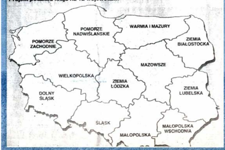
Projekt podziału kraju na 12 województw