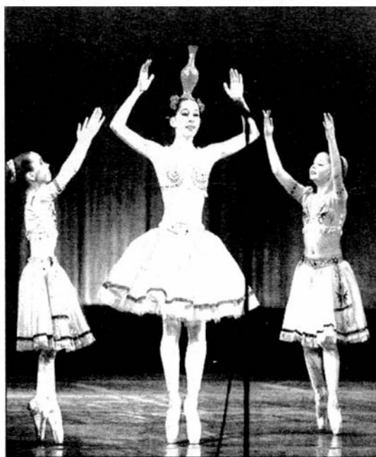
Taniec z dzbankiem z baletu "Bajaderka" choreografia M. Petipa

18 i 22 marca w Kijowie w Teatrze Narodowym Opery i Baletu odbył się Międzynarodowy Festiwal zatytułowany: "Dzieci i gwiazdy Baletu Światowego".