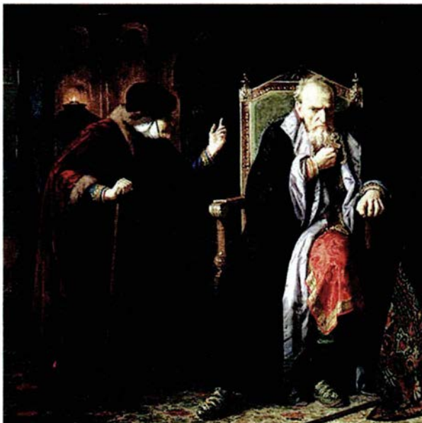
Iwan Groźny i jego niania (Carl Wenig)

Plany Iwana IV zdobycia przez Rosję dostępu do Bałtyku, czyli Europy, legły w gruzach. Skutecznie opóźniło to proces wzrostu hegemonii państwa rosyjskiego w regionie o prawie sto lat. Najbliższym współpracownikiem i wiernym sojusznikiem króla w okresie jego panowania w Polsce był kanclerz wielki koronny Jan Zamojski. Niezmiernie utalentowany, przyczynił się do politycznych i gospodarczych sukcesów