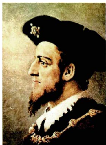
Zygmunt II August

króla, a także wojskowych, jako hetman wielki koronny. W czasie swego urzędowania, Jan Zamoyski stał się jednym z najbogatszych magnatów w Europie będąc także wielkim mecenasem sztuki.