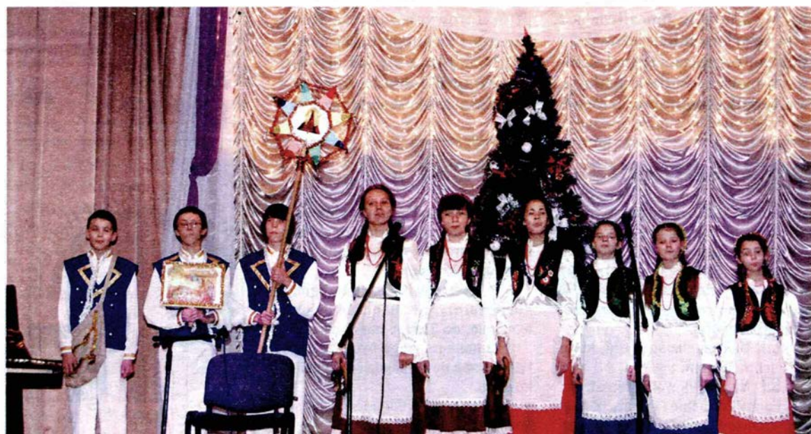
Dzieci Zespół Wokalny „Dzwoneczki” m. Żytomierz