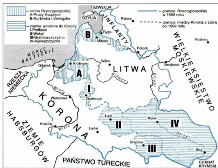
Rzeczpospolita Obojga Narodów w 1569 roku

Wyłamał się z niej patrycjat Gdańska, ważnego portowego grodu korzystającego ze znacznej niezależności. Ponieważ pozwolił sobie na nie wpuszczenie Batorego do miasta, ten 20 IX 1576 r. wprowadził jego ekonomiczną blokadę, kierując cały spław polskiego zboża do portu w Elblągu. W trzy tygodnie później, po śmierci Maksymiliana II, dalszy opór portu stał się już wprawdzie bezcelowy, ale niespodziewanie dla obu