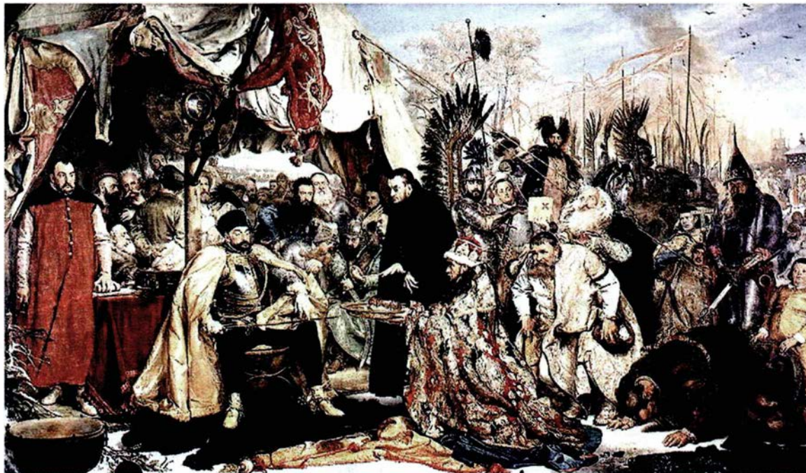
Batory pod Pskowem. Jan Matejko

Rzeczpospolita istniała dwa stulecia, targana licznymi wojnami i wewnętrznymi konfliktami oraz osłabiana odśrodkowymi poczynaniami Litwy czy też partykularną postawą książąt Rusi, a także fermentem wyznaniowym i anarchią w okresach bezkrólewia.