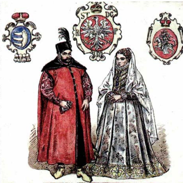
Zaślubiny Anny Jagiellonki i Stefana Batorego