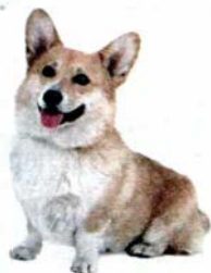
Welsh corgi pembroke - „w małym ciele wielki duch!”

Między psem i człowiekiem istnieje związek telepatyczny. Bliskość emocjonalna, a nie fizyczna odległość odgrywają tu rolę. Można to sprawdzić w prosty sposób. Poprosić kogoś w domu, by obserwował jak twój pies zachowuje się, gdy zbliżasz się do domu. Najczęściej okaże się, że kilka minut przed twoim przyjazdem, pies drepcze do drzwi i czeka. Psy częściej nawiązują telepatyczną więź z kobietami niż mężczyznami. Aż 85 procent psów czuje telepatyczną więź z ich właścicielami.