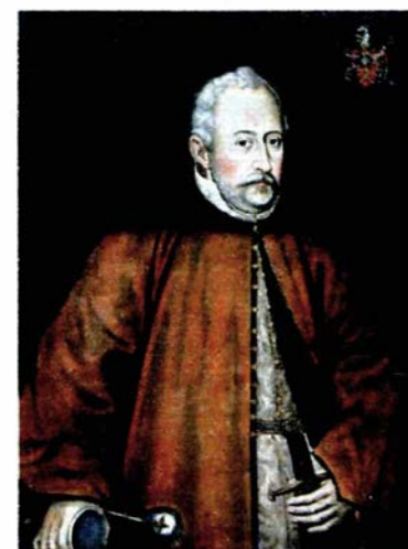
Kanclerz wielki koronny Jan Zamojski