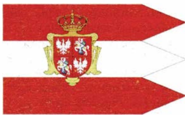
Flaga Rzeczypospolitej Obojga Narodów

Dzięki temu w chwili zawierania Unii lubelskiej aż 2/3 Wielkiego Księstwa Litewskiego i połowę Królestwa Polskiego stanowiły ziemie ruskie. Należy podkreślić, że wówczas na Litwie i w Polsce nie tylko szanowano prawa i tradycje Rusinów, ale także sprzyjano ich ambicjom politycznym. Naturalnym tego efektem była obecność wśród posłów, współpracujących w 1569 r. w Lublinie Rzeczpospolitą Obojga Narodów, wielu Rusinów.