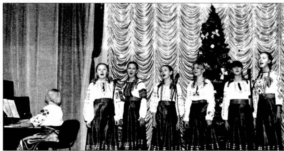
Zespół wokalny „Jaskółka” reprezentował Związek Polaków Ziemi Olewskiej