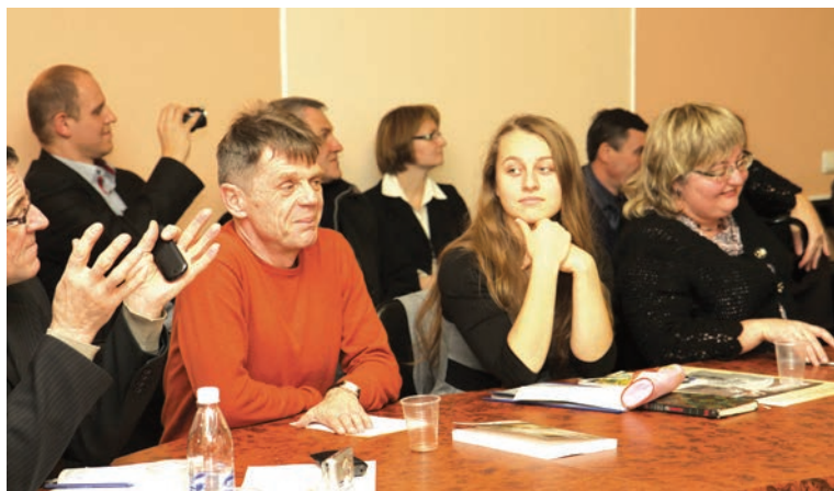
W trakcie dyskusji na seminarium w Uniwersytecie (w centrum autor materiału)

Jego tematem przewodnim stała się bardzo aktualna obecnie sprawa partycypacji obywatelskiej w życiu społeczno-politycznym w Europie Środkowo-Wschodniej. Tradycyjnie już w pierwszym dniu obradowano w Kijowie, w Instytucie Państwa i Prawa Narodowej Akademii Nauk Ukrainy.