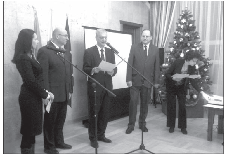
Przemawia prezes Polskiej Akademii Nauk prof. Michał Kleiber

Ceremonia uroczystego otwarcia Przedstawicielstwa połączona została z wręczeniem nagród laureatom Konkursu na wspólną nagrodę Prezesa Polskiej Akademii