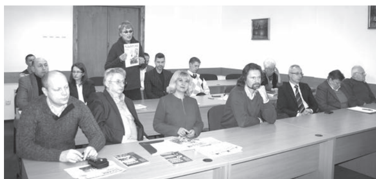
Panele były bogate w liczne pytania i wyczerpujące odpowiedzi