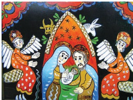
Ewelina Pęksa Szopka