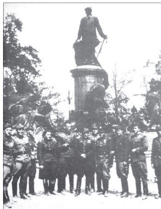
Oficerowie 3 Brygady Artylerii Haubic pod pomnikiem Bismarcka w Berlinie

Jej szlak życiowy był nieprosty. Przeżyła stalinowską deportację, II wojnę światową, siedmioletni pobyt w Syberii. Wychowała dwoje dzieci, wnuków, którym pomogła otrzymać wyższe wykształcenie. Była dobrą matką, babcią i bardzo