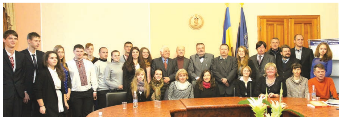
Uczestnicy IV Międzynarodowego Seminarium Naukowe ku czci Wacława Lipińskiego