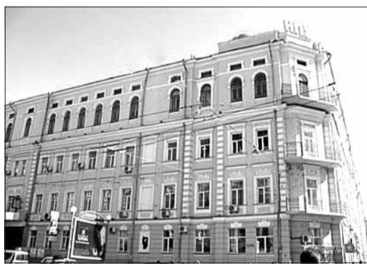
Budynek Kijowskiego Instytutu Handlowego (wówczas przy Bulwarze Bibikowskim 24), w którym działało Polskie Kółko Studenckie (obecnie Uniwersytet Pedagogiczny im. Dragomanowa - Bulwar Tarasa Szewczenki 14)