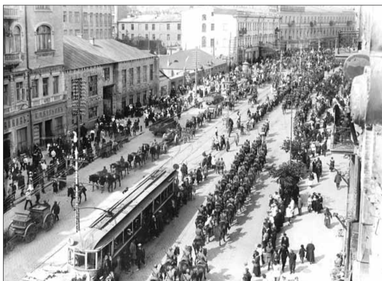
Wojsko polskie wkracza do Kijowa. Ulica Wielka Włodzimierska. 7 maja 1920 roku

Od sierpnia 1919 toczyły się w Warszawie poufne rokowania polsko-ukraińskie,