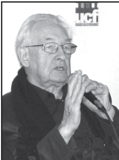
Andrzej Wajda po premierze filmu «Katyń» w Kijowie, 2008 rok