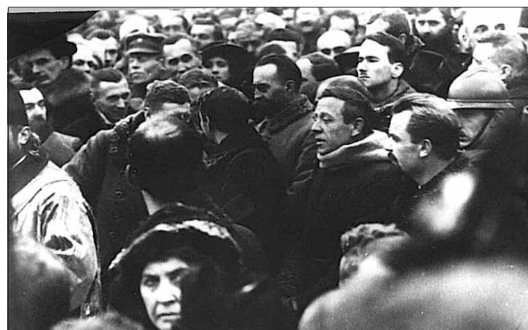
** 22 I 1919 r. na placu Sofijskim w Kijowie ogłoszono Akt Zjednoczenia Ukraińskiej Republiki Ludowej i Zachodnio-Ukraińskiej Republiki Ludowej, na mocy którego oba państwa połączyły się, przy czym ZURL zachowała autonomię jako Zachodni Obwód Ukraińskiej Republiki Ludowej (w centrum S. Petlura i W. Wynnyczenko)