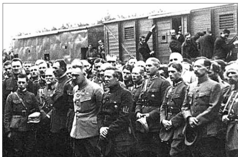
Symon Petlura i Józef Piłsudski (Stanisławów 1920)

Po zajęciu tego miasta przez bolszewików w maju 1919 r. rząd ukraiński zawarł rozejm z Polską. Pozwoliło to na reorganizację armii i - dzięki zamknięciu frontu polskiego oraz wybuchowi anty bolszewickich powstań chłopskich - przeprowadzenie skutecznego kontrnatarcia, które m.in. wyzwoliło w czerwcu Kamieniec. Z kolei przeprowadzona w tym samym czasie ofensywa Armii Białych Rosjan (Armii Ochotniczej) pod dowództwem gen. Antona Denikina doprowadziła do zajęcia przez nich Kijowa (31 VIII 1919).