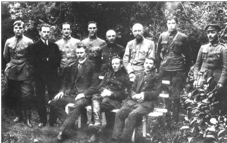
Członkowie Dyrektoriatu Ukraińskiej Republiki Ludowej, siedzą: A. Makarenko, S. Petlura, F. Szwec (Kamieniec Podolski, 1919)

Denikin nie godził się na niepodległość Ukrainy. Na zdobytych ziemiach ukraińskich Biali głosili ideę jedynej i niepodzielnej Rosji, niszczone ukraińskie szkoły i organizacje kulturalne, wprowadzano masowe represje wobec ukraińskiej inteligencji. Latem 1919 roku na ziemiach ukraińskich sytuacja polityczna była zatem wielce skomplikowana, ale i niekorzystna dla bolszewików, bowiem większość terytorium Naddnieprza znajdowała się pod kontrolą Polski lub walczących ze sobą URL/UHA i Armii Ochotniczej Denikina. Walki te trwały do