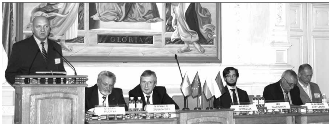
Na ceremonii otwarcia przemawia Dyrektor Przedstawicielstwa Polskiej Akademii Nauk w Kijowie prof. Henryk Sobczuk

Współpracy między uczelniami, instytucjami badawczymi i przedsiębiorstwami przemysłowymi w Polsce i na Ukrainie w tej niezwykle ważnej dla przyszłości całej ludzkości dziedzinie poświęcona została kolejna, XVII Międzynarodowa Konferencja Naukowo-Praktyczna pod dewizą „Energetyka odnawialna i efektywność energetyczna w XXI stuleciu”, która przebiegała w dniach 28 - 29 maja w Narodowym Technicznym Uniwersytecie Ukrainy „Kijowski Instytut Politechniczny im. Igora Sikorskiego”.