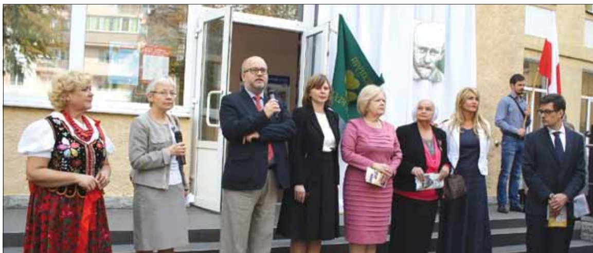
Przemawia radca minister Ambasady RP w Kijowie Rafał Wolski