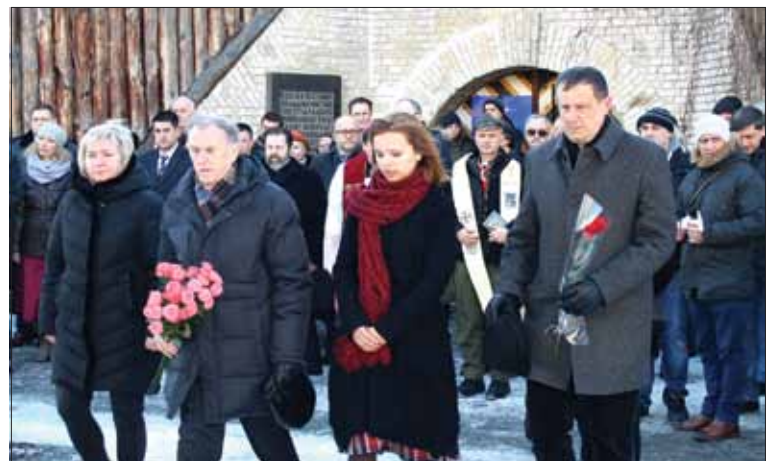
Przedstawiciele Związku Polaków na Ukrainie uszanowali bohaterów poległych w walkach pod hasłem „Za wolność waszą i naszą!”