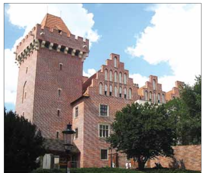
Zamek Królewski w Poznaniu