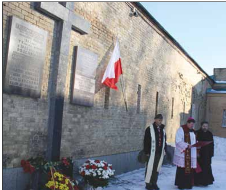
Wspólna modlitwa przed miejscem straceń powstańców