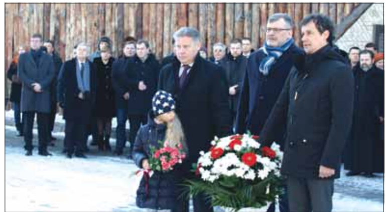
Kosz kwiatów od organizatorów i sponsorów przedsięwzięcia: Międzynarodowego Stowarzyszenia Przedsiębiorców Polskich na Ukrainie i Kompanii „Plastics-Ukraina”

Był to najwyższy organ tajnej policji Imperium Rosyjskiego, do kompetencji którego należało zbieranie informacji o tajnych stowarzyszeniach, inwigilacja osób podejrzanych i śledzenie cudzoziemców. Jako, że gromadził on pełne listy uczestników powstania, często ich życiorysy i charakterystyki, a ponadto dane o konfidentach i zdrajcach - materiały te są dziś nieocenionym źródłem dla nowych opracowań i historycznej analizy