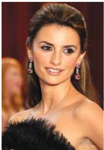
Penélope Cruz – hiszpańska aktorka, tancerka, laureatka Oscara

– córka Periboi i Ikariosa, postać w Odysei, żona Odyszeusza, wzór wiernej żony ; przez okres dwudziestu lat oczekiwała powrotu męża (10 lat wojny trojańskiej i 10 lat tułaczki Odyszeusza), zwodząc ubiegających się o jej rękę zalotników (przyrzekła wybrać jednego z nich na męża, gdy ukończy tkąć szatę dla swojego teścia) przy pomocy podstępny, aby odwlec ukończenie szaty, pruć nocą tkaninę, nad którą pracowała w dzień, stąd drugi frazeologizm: praca Penelopy - praca niekończąca się, nie przynosząca żadnych korzyści.