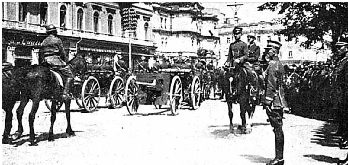
Generał Rydz-Śmigły przyjmuje defiladę w Kijowie, 7 maja 1920 r.

nie spowodowany był odmową przepuszczenia jednostek ukraińskich przez tę węzłową stację kolejową. Pod Bachmaczem objął posterunek oddział kijowskich podchorążych i kadetów w Kijowie, którymi dowodził Mykoła Płatonowycz Sulima, kapitan lejbgwardii Pułku Kirasjerów, doświadczony weteran walk. Szalony atak czerwonogwardystów, wspierany przez prawie 2 tys. rewolucyj-