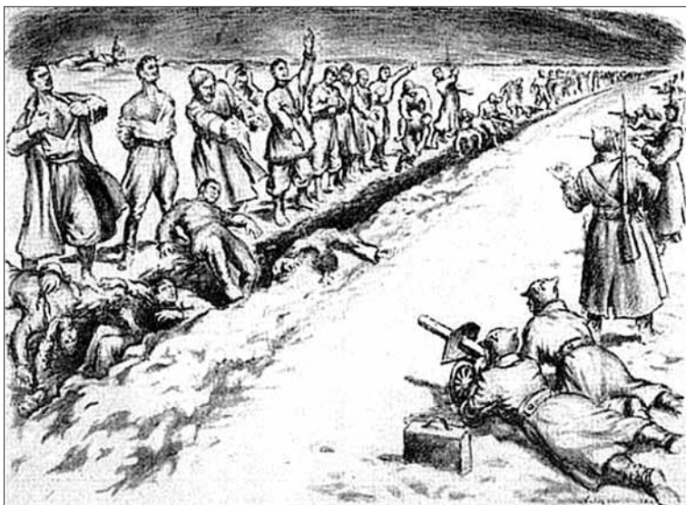
Tragedia pod Bazarem. Bolszewicy rozstrzelali 359 bohaterów Listopadowej Wyprawy URL (YHP) (1921r.)

Roman SLEPENCZUK (Materiał w oparciu o książkę „Sulimy: Dziedzictwo przodków”) Tłumaczenie: S. Panteluk