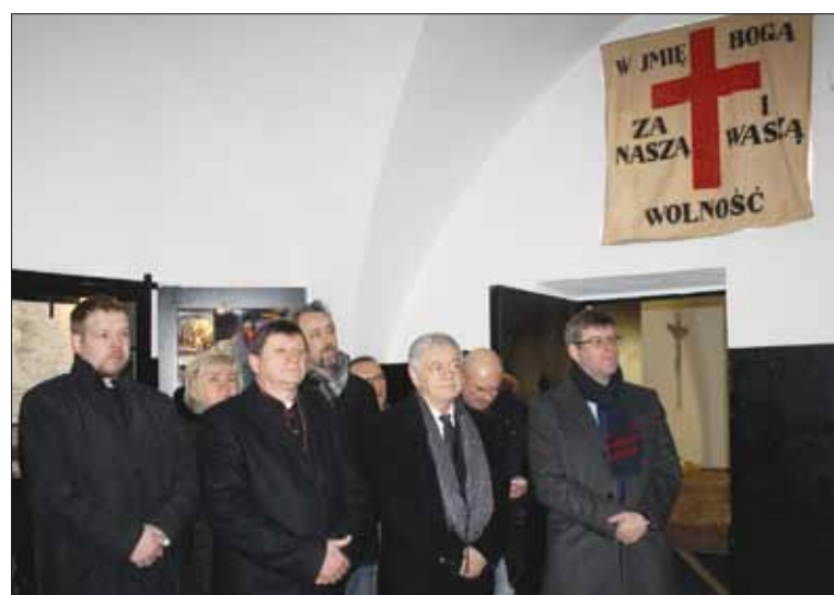
Podczas zwiedzania ekspozycji w Skośnej Kaponierze

pamiętnej egzekucji dowódców oddziałów powstańczych usłyszeliśmy: ... przysięgam z bronią, jaka będzie mi daną, rozpocząć walkę z wrogiem Ojczyzny i aż do ostatniej kropli krwi przelać do Jej oswobodzenia - słowa roty przysięgi, którą 154