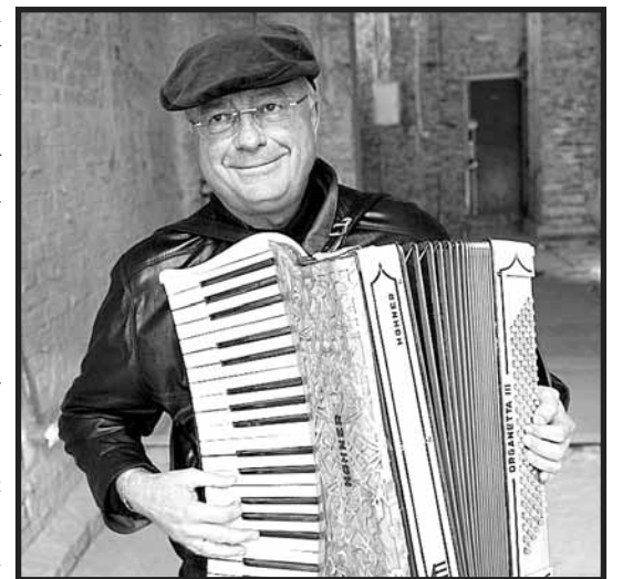
Stanisław Ryszard Wielanek (1949 - 2016), założyciel Kapeli Czerniakowskiej

Nie tylko nagrał, także parę tysięcy razy wziął udział w różnych imprezach estradowych, zabawach tanecznych, (także, a jakże) weselach, nie mówiąc o dość częstym występowaniu w środowiskach polonijnych, chyba całego świata. Leczn, jakby nie dość jeszcze tego było,