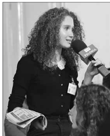
Prezentacja „DK” na sesji dziennikarskiej

Program obfitował w warsztaty o różnorodnym zakresie tematycznym - od prawa do