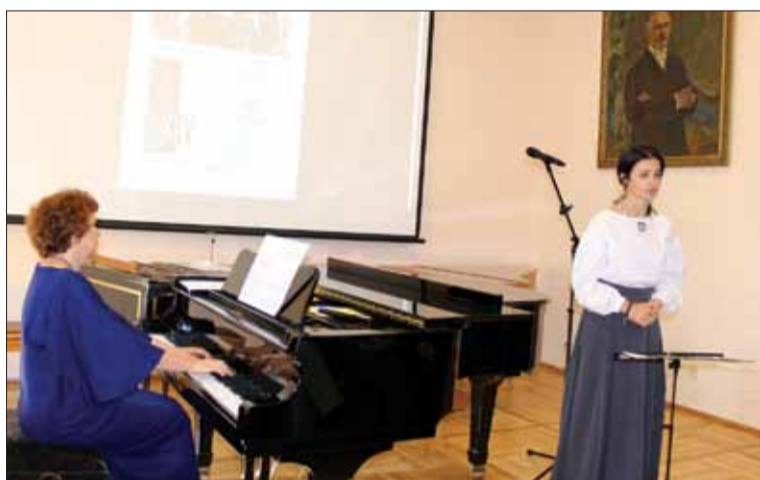
W Kijowskiej Akademii Muzycznej podczas prezentacji antologii: „Szymanowscy. Blumenfeldowie. Neigauzowie: rodziny muzyczne na styku kultur” naprzemiennie brzmiała informacja o wydaniu i muzyka omawianych kompozytorów