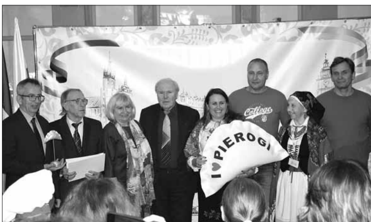
Dla wszystkich chętnych proponowano specjalne warsztaty z lepienia pierogów