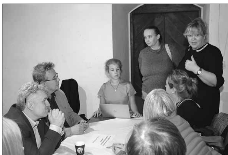
Spotkaniom towarzyszyła żywa dyskusja i atmosfera wzajemnego zrozumienia.

fotografii. W jednym z dni Forum dla podniesienia efektywności poziomu edukacji w odpowiedniej dziedzinie podzielono wszystkich uczestników na grupy, według rodzaju działalności, jako że w Forum brali udział dziennikarze prasowi,