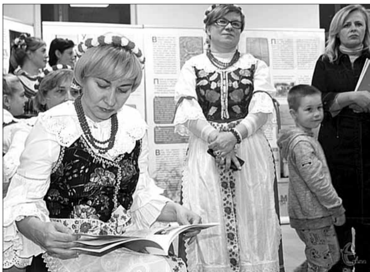
Potomkowie Mazur mogli poczytać o swojej historii podczas prezentacji projektu

„Dziennik Kijowski” można zaprenumerować na 2019 rok na poczcie!!!