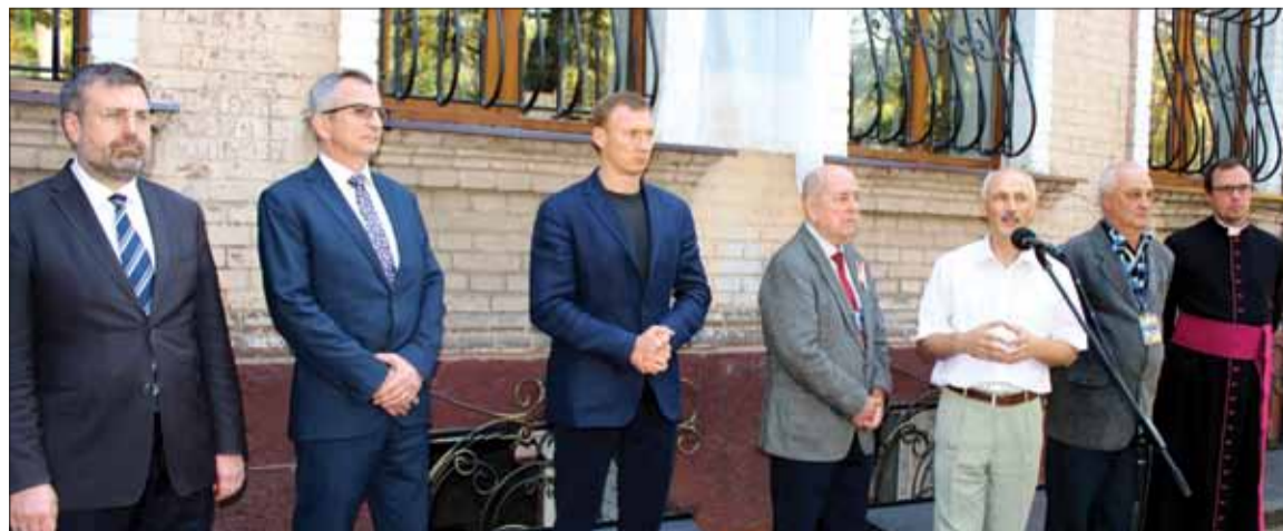
Uroczysty moment odsłonięcia tablicy pamiątkowej znanego pisarza i dramaturga - Jerzego Oleszy