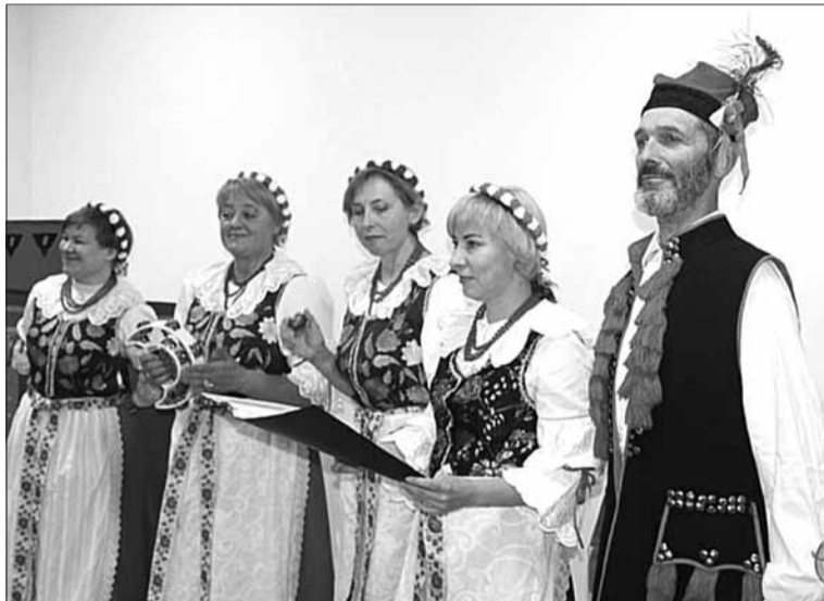
Prezentację projektu uświetnił występ ludowego chóru „Rozmaryn”

24 września w Chmielnickim Centrum Młodzieży zaprezentowano projekt „Śladami ukraińskich Mazurów”. Od czerwca przedstawiciele Ośrodka Sportowo-Kulturalnego „Ploskirów” wraz z wolontariuszami zbierali stare fotografie, dokumenty i opowieści rodzinne mieszkańców, poświęcone historii Mazurów zamieszkujących Chmielniczczyznę. Efektem kilkumiesięcznej pracy była wystawa, wydanie książkowe i strona internetowa poświęcona temu tematowi.