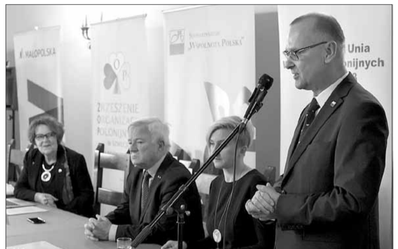
Uroczyste otwarcie obrad Forum II Światowego Forum Mediów Polonijnych