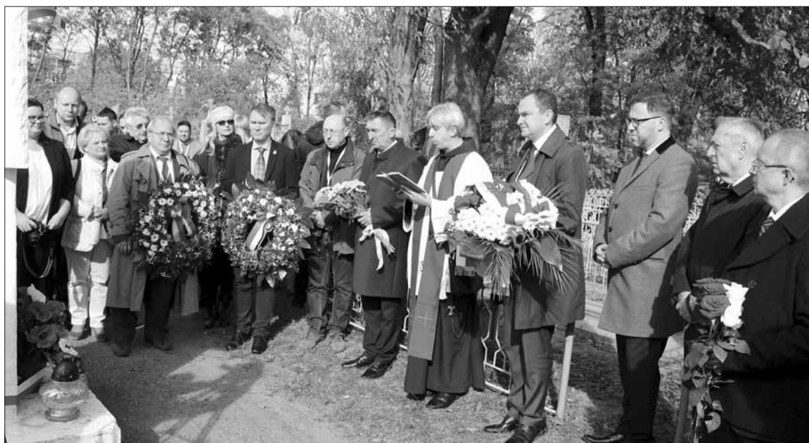
Złożeniem wieńców, modlitwą i chwilą milczenia uczczono pamięć poległych Polaków w szeregu miejsc ich pochówku

Adam Kwiatkowski przekazał pozdrowienia od prezydenta Andrzeja Dudy wszystkim uczestniczącym w zjeździe przedstawicielom polskich mediów na Wschodzie. Podkreślił, że Monitor Wołyński jest swoistym fenomenem, który łączy nie tylko Polaków, ale też Ukraińców, w poszukiwaniu prawdy i w budowaniu na tej prawdzie przyszłości.