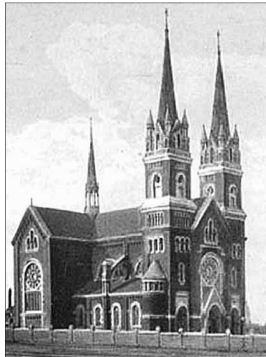
Pierwszy kościół parafialny wysadzony przez bolszewików w 1937 r.

Z nich ponad 13,9 tys. posługiwało się językiem polskim. Niemal wszyscy w tej grupie byli rzymskimi katolikami