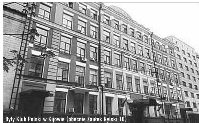
Były Klub Polski w Kijowie (obecnie Zaulek Ryłski 10)

woluminów, w 1927 r. - 29539 (jednak tylko 12337 woluminów przeznaczone były do użytku publicznego, a pozostałe książki znajdowały się w zasobach archiwalnych). W 1928 r. księgozbiór liczył ponad 33000 woluminów, a w roku 1931 - 48 000 woluminów. Jednocześnie w zasobach bibliotecznych zorganizowano dział naukowy stanowiący 35 tysięcy woluminów. W Centralnej Polskiej Bibliotece Państwowej w Kijowie gromadzono także prawie wszystkie czasopisma w języku polskim, wydawane w ZSRR, w tym takie jak: „Sierp”, „Gwiazda Młodzieży”, „Głos Młodzieży”, „Trybuna Radziecka”, „Do światła”, „Myśl bolszewicka” i inne. Oczywiście bibliotekę uzupełniano w przeważającej części sowieckimi wydawnictwami polskojęzycznymi, drukowanymi głównie w celach propagandowych.