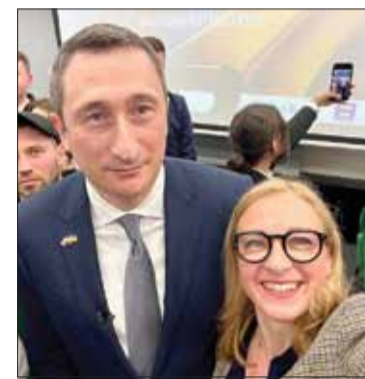
Z wicepremierem Ukrainy – Ministrem Jedności Narodowej – Ołeksijem Czernyszowem