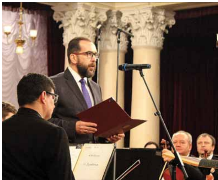
Przed koncertem Chargé d'affaires Rzeczypospolitej Polskiej na Ukrainie Piotr Łukasiewicz wygłosił przemówienie powitalne do zgromadzonych