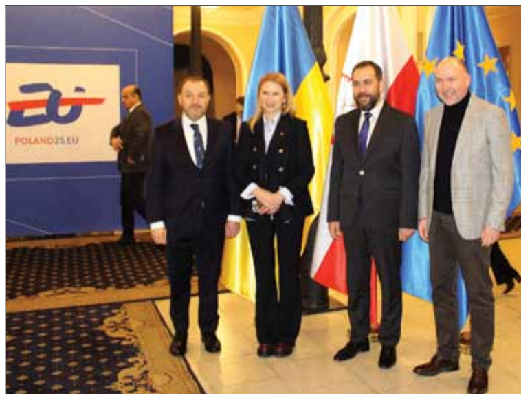
Na zaproszenie Chargé d'affaires Rzeczypospolitej Polskiej w Ukrainie Pana Piotra Łukasiewicza na koncert przybyli czcigodni goście, w tym wiceprzewodnicząca Rady Najwyższej Ukrainy Olena Kondratiuk

W imieniu rządu ukraińskiego przemówienie powitalne wygłosili: wiceprzewodnicząca