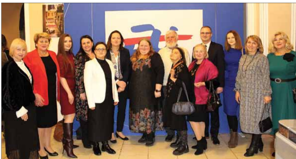
Polscy dyplomaci w gronie przedstawicieli społeczności polskiej Kijowa