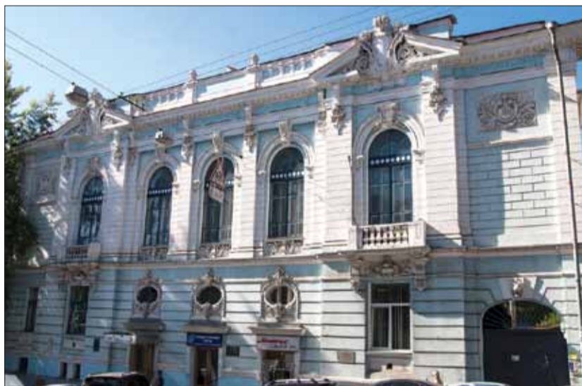
Współczesny wygląd „Auditorium Ludowego” przy ulicy Bulwarno-Kudriawskiej 26 w Kijowie

Materiał powstał przy wsparciu Polpharmy w ramach projektu «Pamięć, która łączy: lekarze polskiego pochodzenia w historii Kijowa», ujawniającego nazwiska i mało znane karty wspólnego dziedzictwa medycznego Ukrainy i Polski. Polpharma – największy producent leków w Polsce z ponad 90-letnią historią. Od ponad 20 lat firma działa również na Ukrainie, posiadając portfel ponad 600 leków na receptę i bez recepty – w tym stosowanych w leczeniu chorób kardiologicznych, neurologicznych i okulistycznych.