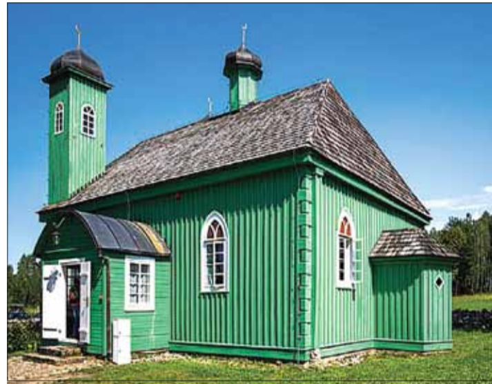
Drewniany meczet w Kruszynianach. 60 km na wschód od Białegostoku, przy granicy z Białorusią.

Mimo upływu wieluset lat zachowali odrębność kulturową i religijną - są wyznawcami Islamu. Ciekawostką może być fakt, że potomkiem tatarów zamieszkujących dawniej Rzeczpospolitą był znany amerykański aktor Charles Bronson.