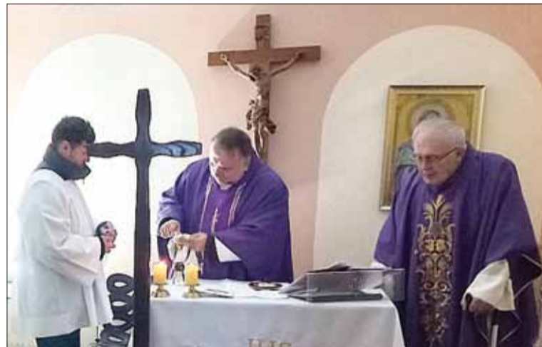
Nabożeństwo 30 listopada 2025 roku w odnowionej krypcie kościoła w Motowilówce