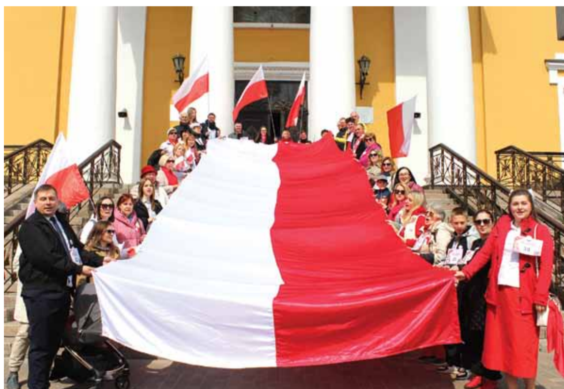
Uroczystości rozpoczęły się przy kościele pw. św. Aleksandra, gdzie uczestnicy wspólnie odśpiewali Marsz Polonii oraz rozwinęli biało-czerwoną flagę Rzeczypospolitej Polskiej – symbol jedności, dumy narodowej i przywiązania do ojczyzny.

Święta majowe to szczególnie ważny czas dla Polski oraz Polaków – również tych mieszkających poza granicami kraju. Ich znaczenie wynika zarówno z historii, jak i z żywych tradycji, które budują tożsamość narodową i łączą kolejne pokolenia. Początek maja to okres uroczystości upamiętniających najważniejsze wydarzenia i symbole polskiej państwowości: 2 maja obchodzony jest Dzień Flagi Rzeczypospolitej Polskiej, który jest jednocześnie Dniem Polonii i Polaków za Granicą, natomiast 3 maja świętujemy rocznicę uchwalenia Konstytucji 3 maja – jednego z najważniejszych dokumentów w historii Polski. (Patrz str. 2)