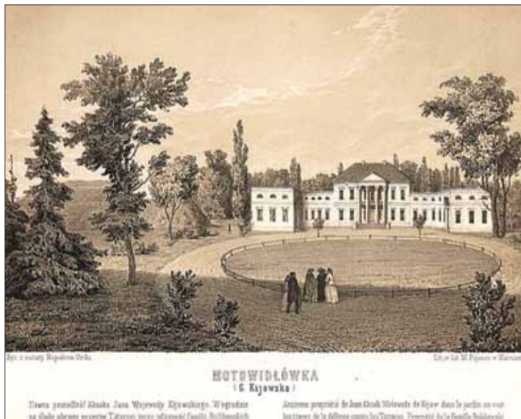
Pałac w Motowilówce, wybudowany przez ojca Edwarda. Rysunek Napoleona Ordy.

Ostatecznie rodzina Rulikowskich przekazała część spuścizny archiwalnej Edwarda jego siostrzenicy Elżbiecie. Ogromne archiwum naukowe, korespondencja i zbiory etnograficzne na początku XX wieku trafiły do San