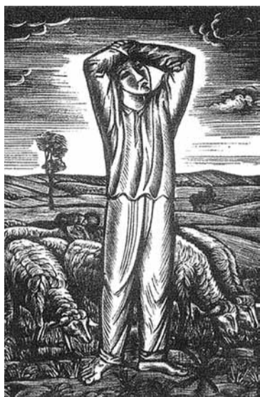
Ilustracja do wiersza Tarasa Szewczenki „Meni trzynadciatyj mynato” („Miałem trzynaście lat”), ksylografia, 1928.

związany z nią konflikcie Bojczuk zaczął budować większy dystans wobec ludzi i emocji. Choć ich małżeństwo nie było wolne od trudności, przez blisko trzy dekady łączyła ich wspólna praca, idee i działalność artystyczna.