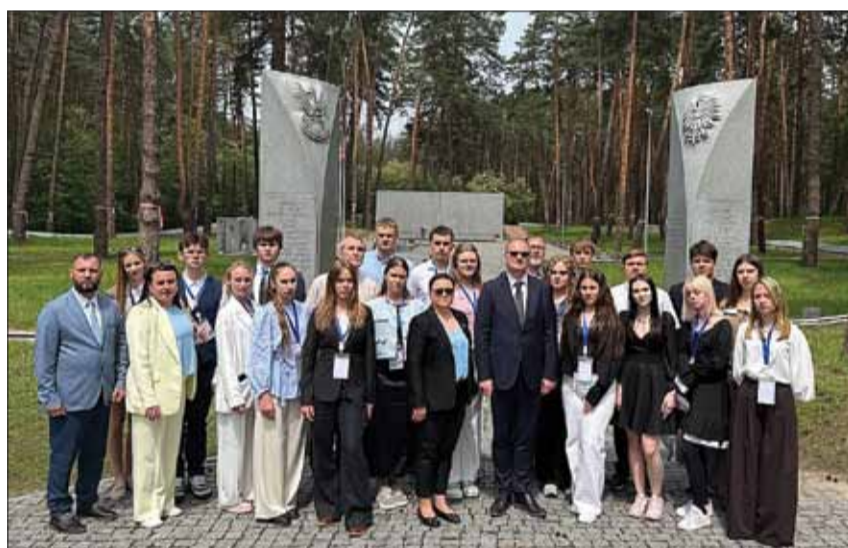
Niezwykle poruszającym momentem była także wizyta na Polskim Cmentarzu Wojennym w Bykowni

„Młodzi ludzie bardzo często posiadają ogromny potencjał, ale nie zawsze wierzą w swoje możliwości. Naszym zadaniem jest pokazać im, że liderstwo zaczyna się od poznania samego siebie,