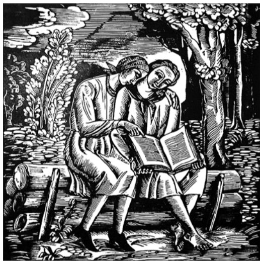
„Dziewczyna z książką”. 1927. Papier, drzeworyt.