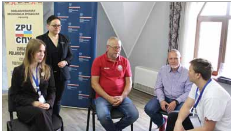
O swojej działalności opowiadają wolontariusze Stowarzyszenia „Wołyński Rajd Motocyklowy”