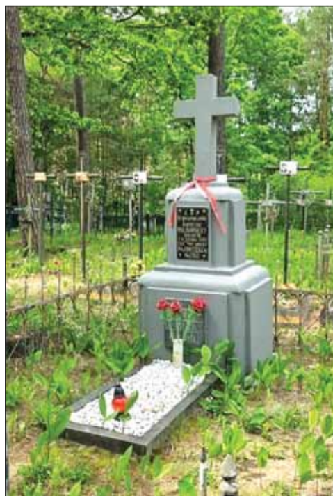
Cmentarz w Budzie Makarowskiej