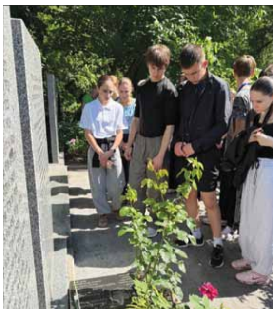
Uczestnicy wzięli udział w porządkowaniu polskich grobów na Cmentarzu Bajkowa w Kijowie