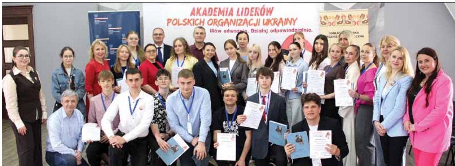
Zwieńczeniem Akademii było spotkanie podsumowujące z udziałem prezesów i aktywistów kijowskich organizacji polskich