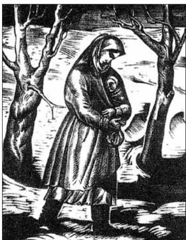
Ksylografia do poematu Tarasa Szewczenki „Kateryna”, 1928.

Historia Bojczuka zaczyna się daleko od paryskich salonów. Pochodził z chłopskiej rodziny. Jego talent dostrzegł miejscowy nauczyciel, Polak z pochodzenia, który wysłał ogłoszenie do lwowskiej gazety z pytaniem, czy ktoś nie szuka ucznia malarza. Dzięki temu młody Bojczuk trafił do Lwowa. Później jego edukację wsparł metropolita Andrej Szeptycki, który wysłał artystę na studia do Paryża. We Francji Bojczuk coraz wyraźniej odchodził od europejskich mód. Zamiast zachwycać się tym, co nowe, szukał inspiracji w ikonach, freskach bizantyjskich